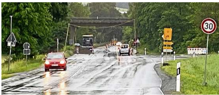
Diese Brücke an der Kreuzung nach Westernbödefeld musste saniert werden. Ab Mittwoch ist die Durchfahrt wieder frei.